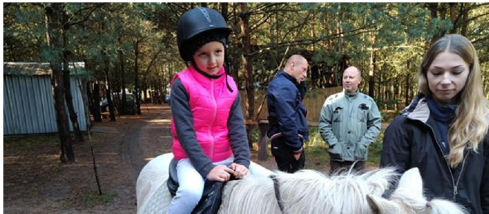
szkole Nr 2 im. Kubusia Puchatka w Hajnówce